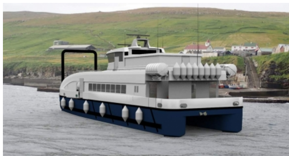
FÆRØYANE: Planen er at med det modulbaserte kaisystemet og automatisk tilkopling til baugen på katamaranen, kan ein frakte passasjerar og tre bilar til stader med vanskelege landingstilhøve.

- Dette er noko vi verkeleg har stor tru på, seier Flø.